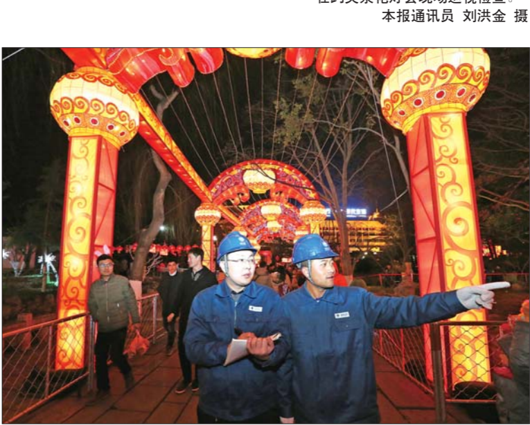
▲趵突泉景区内设置了多个标识引导游客观灯。 ▼济南供电公司用电检查员在趵突泉花灯会现场巡视检查。