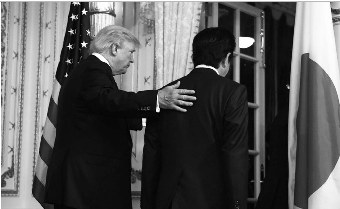
当地时间11日,在美国佛罗里达州棕榈滩,美国总统特朗普与正在访美的日本首相安倍晋三就朝鲜试射导弹一事发表声明后离开记者会现场。

特朗普与安倍10日发表共同声明,把“抵御朝鲜导弹和核威胁”作为“重中之重”的事务。