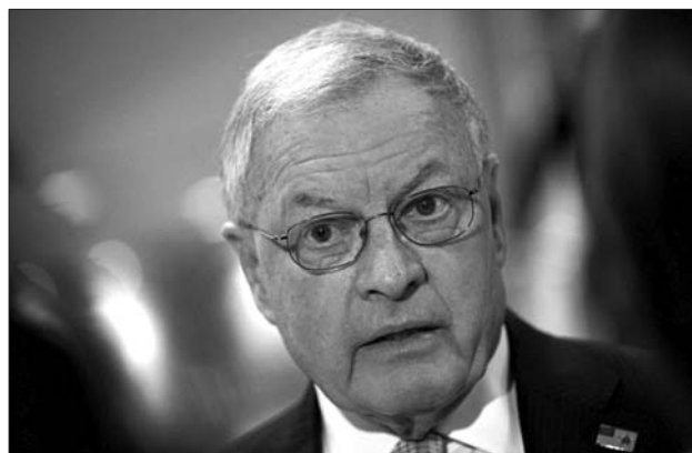
代理国家安全事务助理基斯·克洛格 (资料片)