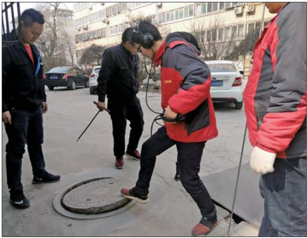
工作人员正在检查漏点。

近日,家住槐荫区元丰花园小区的居民非常心烦,小区高层的超百户居民已经停水一个多月,居民用水只能到楼下去接。这两天,情况更加严重,整个小区和共用一块总表的元丰纺纱厂宿舍的近千户居民都停了水,这让小区居民更加苦恼。经过检漏,小区管网老化导致每天漏水500吨,导致小区高层停水。