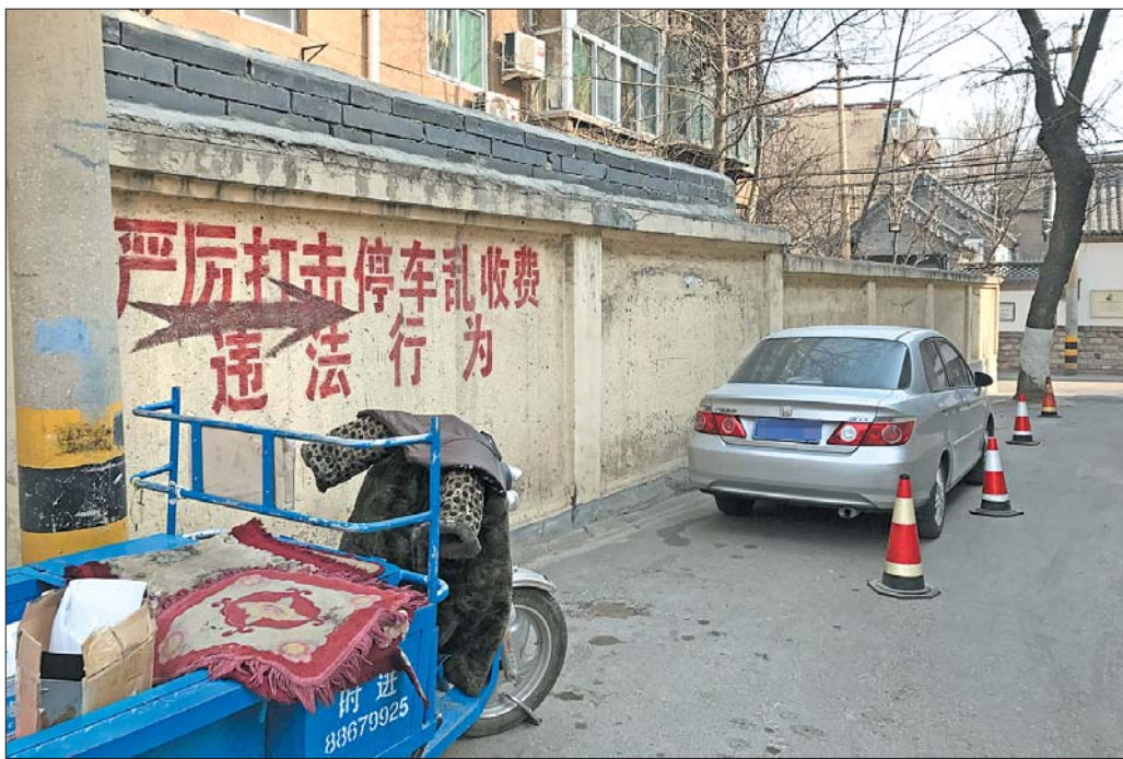
南新街上“严厉打击停车乱收费违法行为”的标语旁边，仍有车辆停放。

据齐鲁医院急诊室东边一家摊贩店主透露，医院附近的“黑停车场”大都是周边住户所设，有的是小区居民私设，有的则是街上一些商贩趁机抢占的，“这是无本生意！一个车位一天收三十，一个月至少能赚