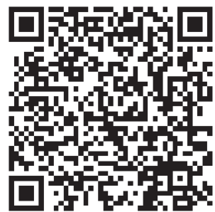
扫码查看大项目名单

其中,碧霞湖文化项目投资总额50亿,将建设成为集剧场、商业中心、艺术中心等于一体的旅游度假区。泰山绿城·玉兰园项目投资也高达50亿,将在王家庄社区,建设玉兰系高端住宅,商务楼、购物娱乐配套设施都涵盖其中。