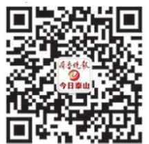
今日泰山微信平台