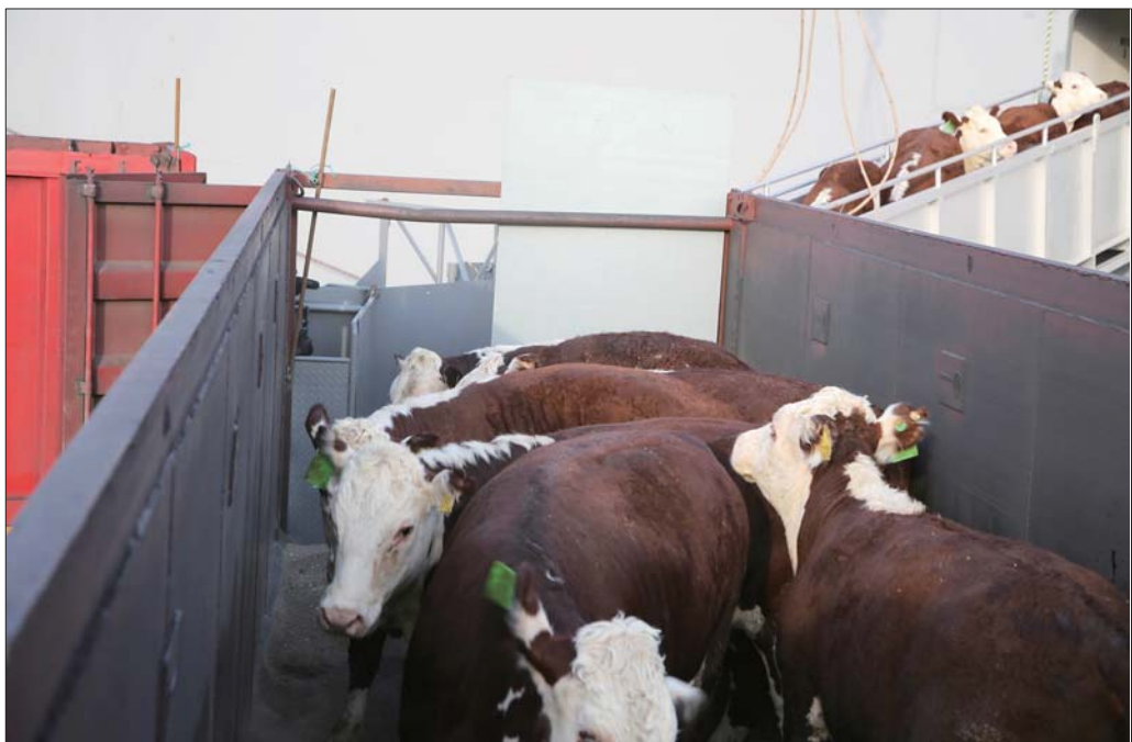
漂洋过海而来的澳洲肉牛。

过质检总局检疫评估的海港口岸。这也是山东省第一个通过检疫评估的进境屠宰用肉牛口岸。此前,国内进口的澳大利亚屠宰用肉牛均是通过空港口岸进口。相比空港口岸,海运不仅具有数量优势,而且每头肉牛节省成本9000元左右。本次进口的澳大利亚屠宰用肉牛品种包括安格斯牛、澳洲和牛和海福特牛,运抵中国前,已在澳大利亚隔离场进行了七天的隔离检疫,由澳大利亚波特兰港出发,历经16天,最终抵达荣成石岛港。澳大利亚是世界第二大牛肉出口国,对草场和放牧、污水、废料和土壤管理极其严格,从未发生口蹄疫和疯牛病等重大疫情。首批澳洲肉牛进入荣成后,将被运送到隔离场,确定无疫病,并且符合澳方的动物福利标准后,将在14天之内完成屠宰,并进入国内市场。