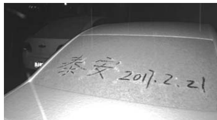
21日晚,市民在爱车上留言。

本报泰安2月21日讯(记者 路伟) 天气阴沉了半天,21日下午,大雪如约而至。泰安市气象台发布了暴雪黄色、道路结冰橙色预警,同时,继续发布寒潮蓝色预警。