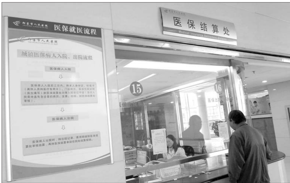
在我省青岛一家医院,市民正在办理医保结算。(资料片)

下一步,山东省将继续扩大应用范围,逐步实现省内所有统筹区域对接,推进跨省异地安置退休人员和符合转诊规定人员的住院费用持社保卡直接结算工作,为我省参保人员异地就医结算提供更多便利。