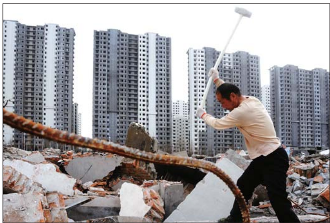
菏泽棚改拆迁工作进展迅速。(资料图)

本报菏泽2月23日讯(记者李德领) 23日,记者从菏泽市第十九届人民代表大会第一次会议上获悉,今年菏泽将以建设富有吸引力和影响力的区域中心城市为目标,以纳入中原城市群发展规划为契机,加快城市基础设施建设,提升新型城镇化的质量和水平。