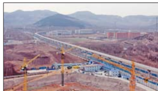
创新谷将引入三甲医院国际学校