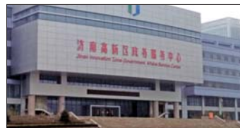
高新区新政务大厅拟3月投用