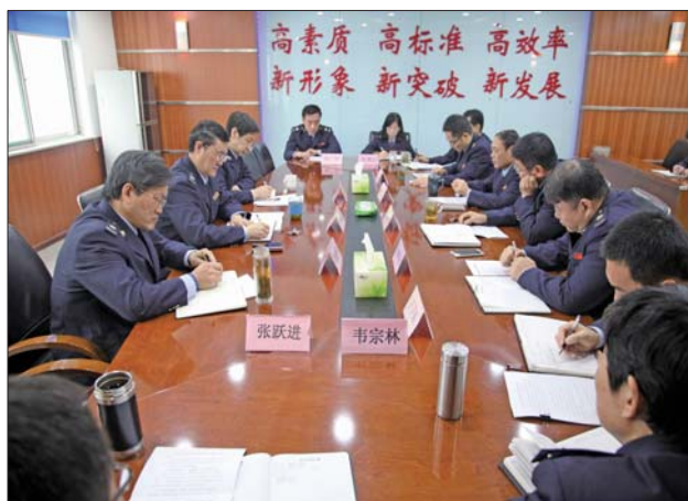
高新地税开展欠税清理专项行动。

在具体工作中,高新地税成立专项行动小组,由分管局长主抓,征管和科技发展处、管理一处、管理二处、孙村中心税所明确责任分工,联合落实这项工作。并多次召开专项