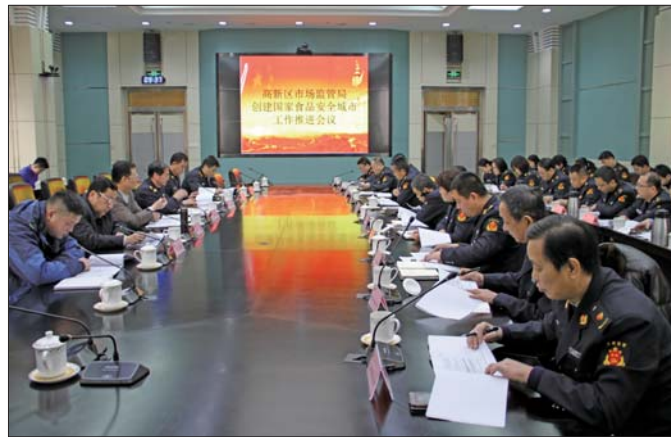
济南高新区市场监管局召开创食安城专题会议。

据了解,为了做好创食安城工作,济南高新区市场监管局已将该项工作列入了市场监管局的KPI考核内容。