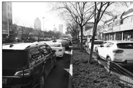
德州市人民医院附近停车难问题严重。

“建议政府牵头,对公共场所的停车位统一规划,统一建设,并制定统一的收费标准。”钟伟大告诉记者,建设资金来源可以为预先承包所得,或者由财政资金先期拨付,以停车收费归还。他还说,需要强调的是,收费标准制定时一定要做好群众听证工作,收费务必合情合理,这样才能确保各项政策顺利推动。