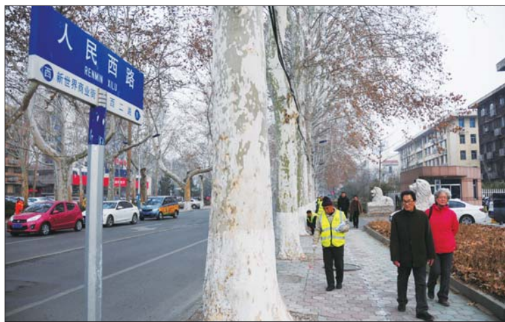
张店人民路改造工程已经开始施工。