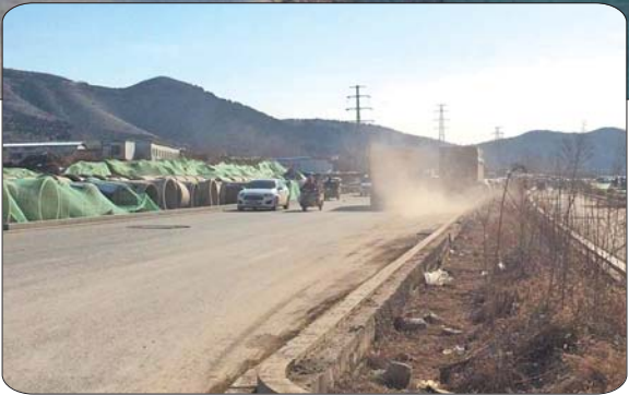
►车辆开过时,路面上尘土飞扬。

时间视水泥厂拆迁时间而定。施工围挡外道路的安全、文明及扬尘防治工作由中海地产集团有限公司负责。