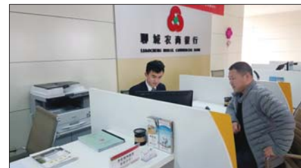
聊城农商银行:推出电子承兑汇票贴现业务。

为持续推动产品创新,满足辖内客户对贴现业务的需求,拓宽业务范围,抢抓优质客户资源。聊城农商银行结合自身实际,吸收借鉴同业先进经验,推出了电子承兑汇票贴现业务,2017年1月15日成功办理电子银行承兑汇票1笔,100万元。电票贴现业务的成功办理既满足了客户的融资需求,同时,填补了聊城市农商系统的业务空白点,丰富了聊城农商银行的产品体系。