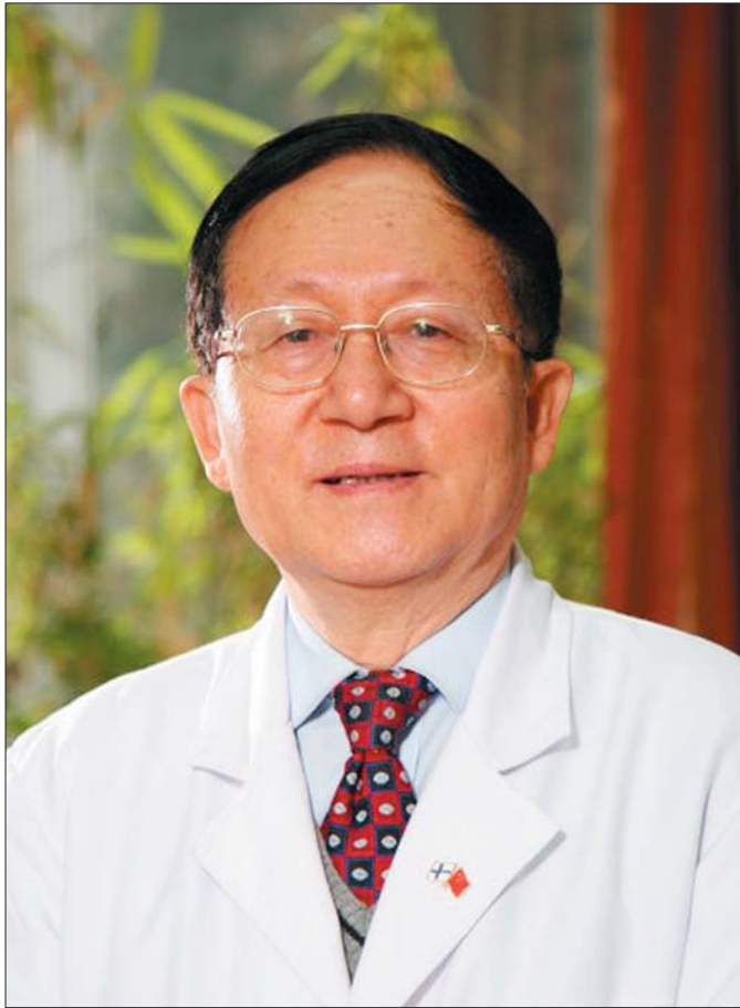
原卫生部首席健康教育专家洪昭光

“中医的哲学思想、西医的药理作用、华罗庚数学的优选法和运筹学，三者有机综合，才形成了O号。降压效果明显，价格便宜，经过40多年的临床检验，O号得到了广大患者的认可。”回忆降压药“O号”的诞生，原卫生部首席健康教育专家、北京安贞医院著名心血管病专家洪昭光骄傲地说。