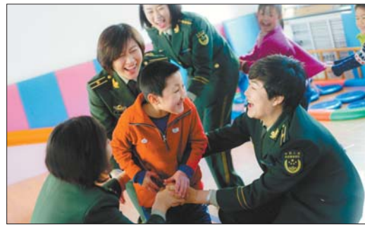
女警官同残疾孩子一起做游戏、讲故事。