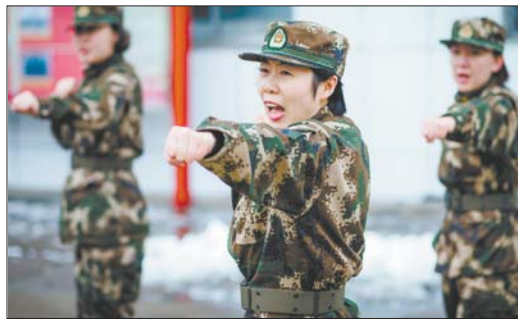
无论严寒酷暑,训练场上巾帼不让须眉。