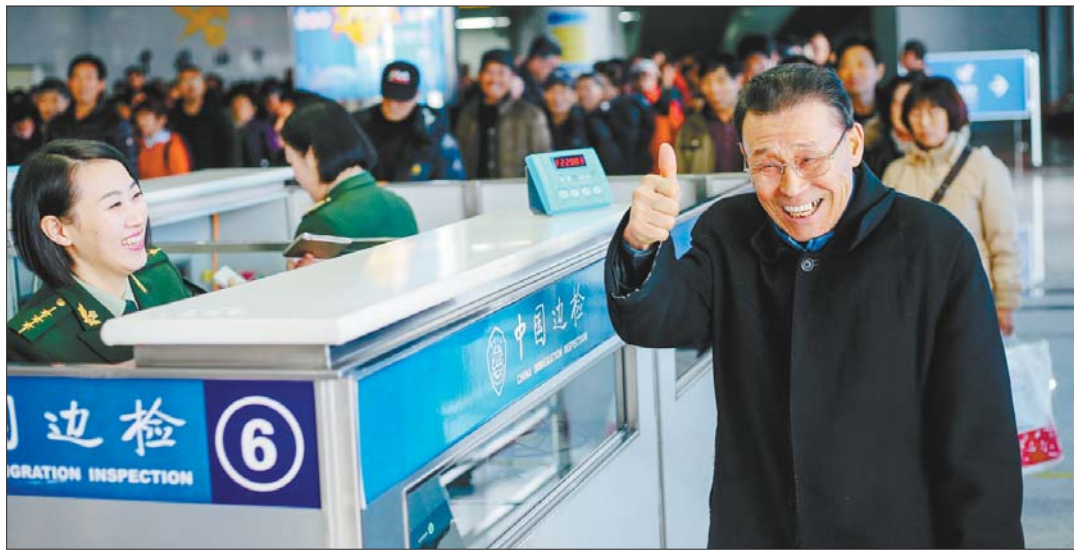
▲女检查员提高识别伪假证件水平,练就一双火眼金睛。