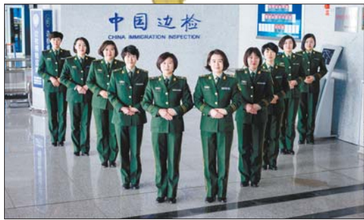
十位警花集体亮相。