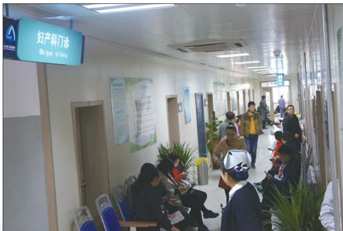
妇产科采取“一贯制”服务管理模式。

“复发性患者绒毛膜中血管内皮生长因子的表达”、“羊水过少诊治的临床研究”等科研项目。在国家级刊物发表文章十余篇,每年在国内外有影响力的学术刊物发表论文数十篇,其中有相当数量的论文被SCI收录。