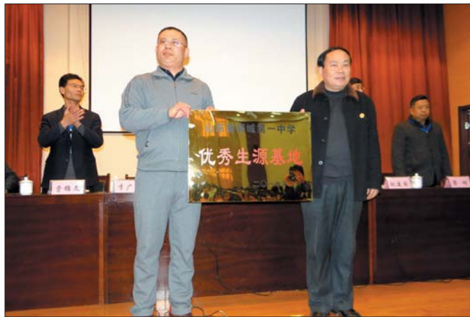
郓城一中为南城中学授牌。