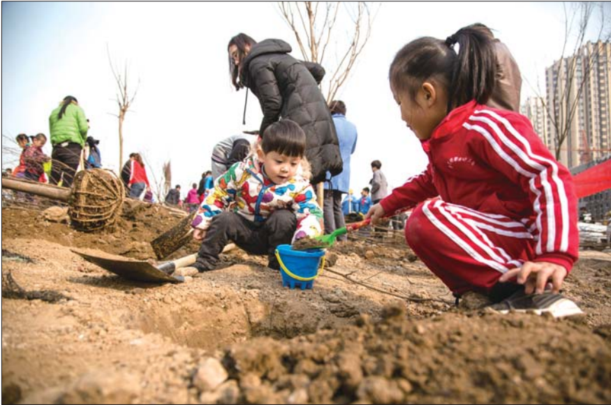
在现场,小朋友干的也很卖力。

本报济宁3月14日讯(记者 于伟 孟杰) 11日,济宁高新区联合齐鲁晚报·今日运河邀请百个家庭,在柳行街道举行“祖孙三代共植树”系列绿化活动。来自管委机关青年、人民银行团委、邹城监狱团委、银监局、农行系统等单位300多人共同参加了植树活动。