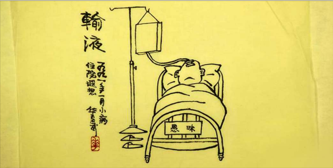
华君武的漫画《输液》

近日,“捐赠”成为艺术圈的关键词。向公立美术机构无偿捐赠自己最有代表性的创作,在画家群体中渐成风气。在他们看来,最好的画应该留在美术馆,为观众共享。正因为他们的慷慨义举,观众才有了眼福,得以近距离欣赏更多的精品佳作。