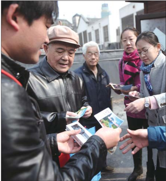
▲工作人员发放景区门票。