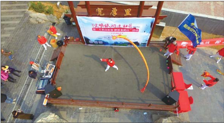
◀文明旅游进社区热场表演。