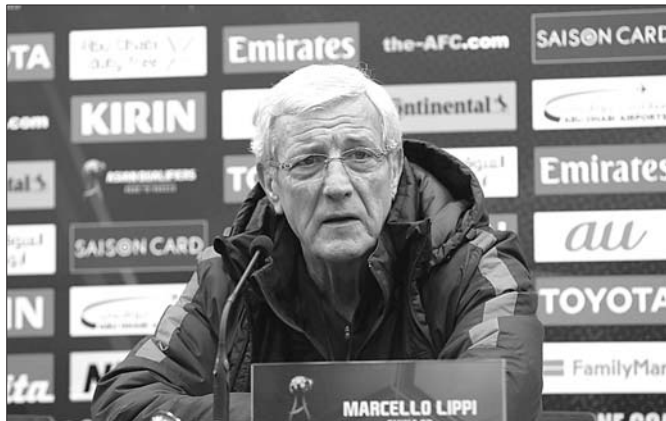
赛前新闻发布会上,里皮坚定取胜信心,不知道比赛中会呈现怎样的对决。

以往中国队对韩国队的全场紧逼战术比较发憊,里皮强调比赛中要“以我为主”,“我们会尊重对手,但比赛中肯定要以我为主,希望发挥出中国队所有球员的能力,我们会尽量找到克敌制胜的办法。究竟有什么办法,希望大家到现场一看究竟。现在我们也考虑上一回合与韩国队的比赛,只会考虑这场比赛。”国足本场比赛的口号是“重压之下无惧色”。对于这句口号的意义,里皮进行了阐释,“从执教国家队第一天开始,我不断向球员反复强调,一定要放下所有的压力和恐惧,他们是在捍卫十四亿中国人的尊严。一旦穿上国家队球衣就要在场上拼尽全力,只要他们能够发挥出自己