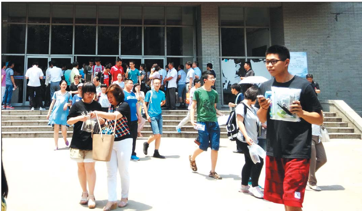
►在南科大自主招生山东考点, 学生走出考场。(资料片)

3月份又进入自主招生季, 各个高校的自主招生简章纷纷出台。和普通高考相比, 自主招生更侧重选拔具有学科特长和创新潜质的优秀学生, 体现了对“一考定终身”式的高考选拔制度的思考和优化。相对而言, 学科成绩优异, 在科技、文学等方面有标志性成果和特殊才能的考生更容易获得资格。今年, 自主招生的试点高校共90所, 其中77所高校面向全国招生。截止到3月24日, 已有81所高校公布了2017年自主招生简章。