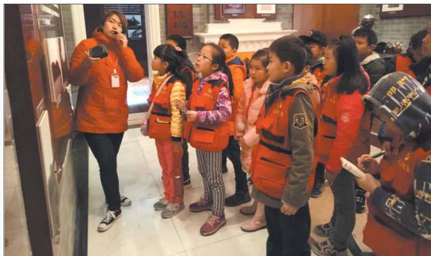
小记者参观邮电博物馆。 本报记者 尹明亮 摄