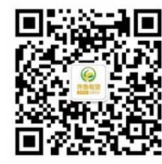
齐鲁有货微信二维码