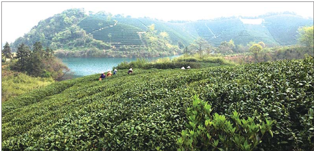
详情可扫码关注了解哦。

陆羽《茶经》谈道：“其地，上者生烂石，中者生砾壤，下者生黄土。”土壤的石砾较多，通透性好，而且有机质和各种矿物质营养元素和各种微量元素一应俱全，能使茶树生长健壮，其保健营养物质丰富。