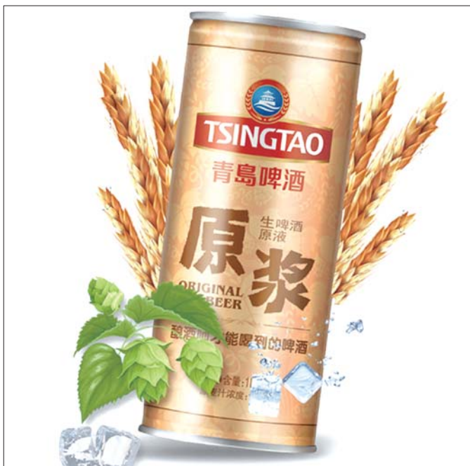
罐装青啤原浆，车展期间买二赠二