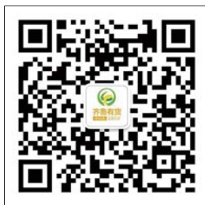
齐鲁有货微信二维码

除了现场购买，市民还可以登录齐鲁有货微店下单购买，同样可以享受买二赠二的优惠哦，还可以免费配送到家，方便快捷。