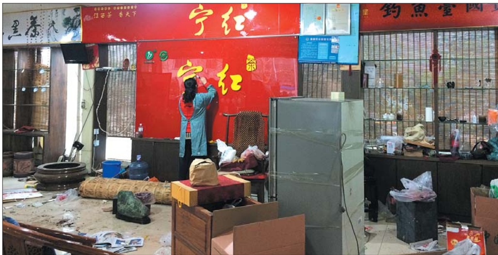
舜和茶城商户正在紧张搬离,一业户在拆除店内招牌。

该负责人说:“今天(4日)我们又召开会议,重点工作放在舜和茶城,目前茶城外边广告牌等具备拆除条件的已经开拆,今晚对茶城已经搬离完