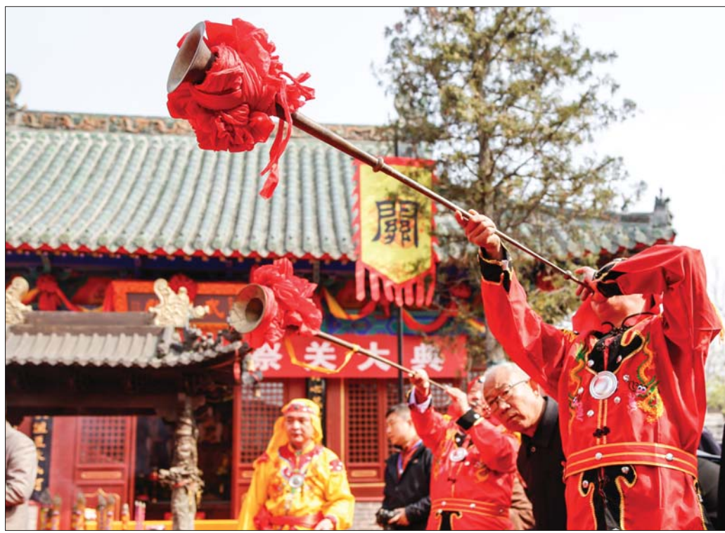
元代大殿前的春祭关公大典。