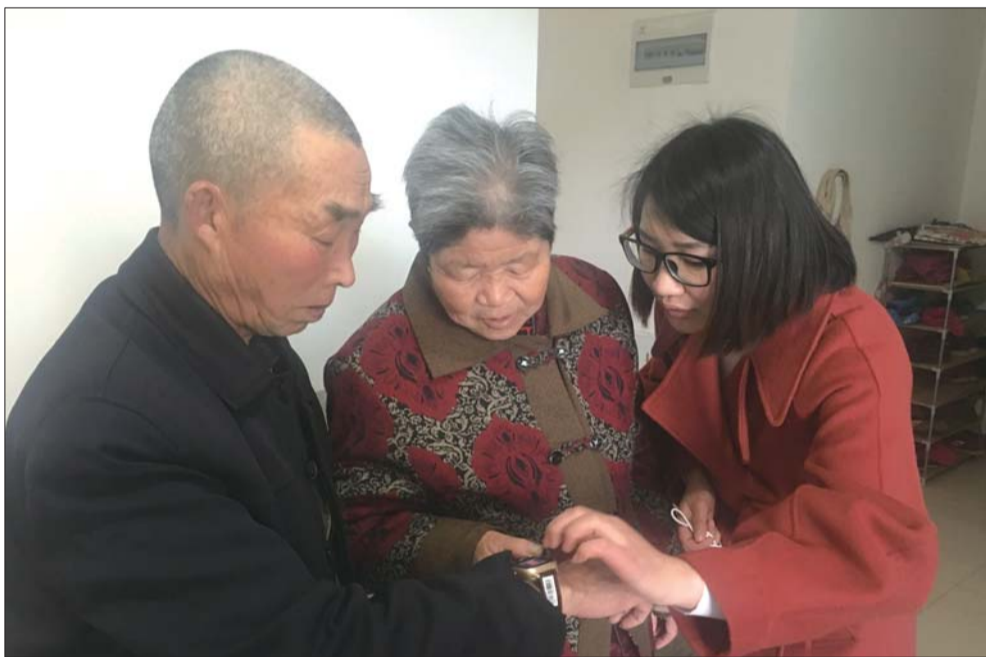
工作人员向老人介绍智能手环的使用方法。

老人今天去了哪?心跳血压是否正常?有无遇到突发情况?……这些让儿女和家人们忧虑的问题,在泇河街道,一个智能手环都能解决。“每天24小时实时监测,实时显示老人的行动轨迹和身体信息,还能提供一键语音服务。”小小的智能手环只是泇河街道试点“智慧养老”的第一步,今后还将打造“互联网+养老”的社区发展新模式。