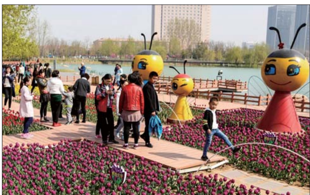
卡通人物增加不少童趣。