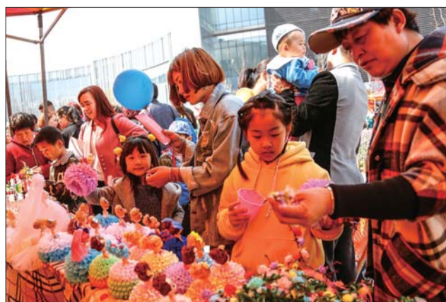
郁金香展上的创意市集吸引了不少小朋友的目光。