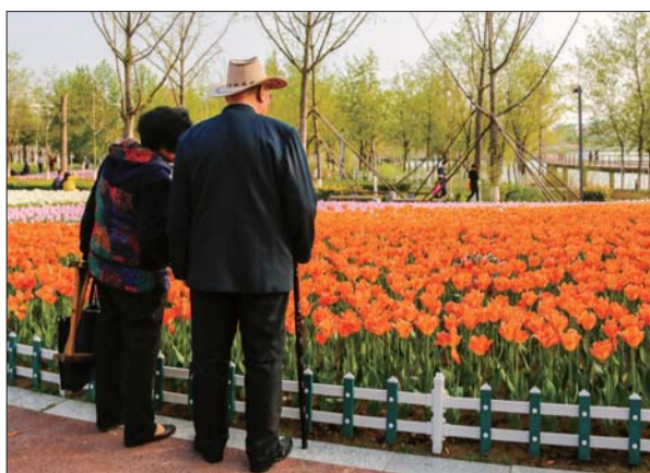
一对老夫妻驻足赏花。