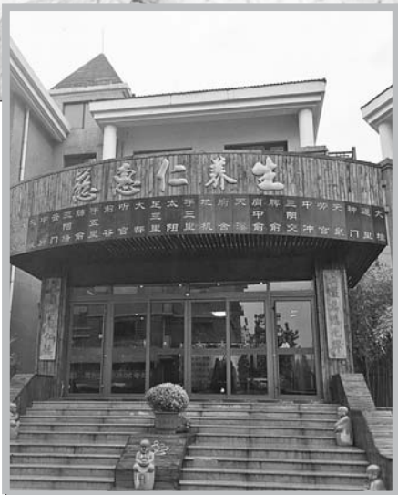
▲双方正在就赔偿事宜协商。