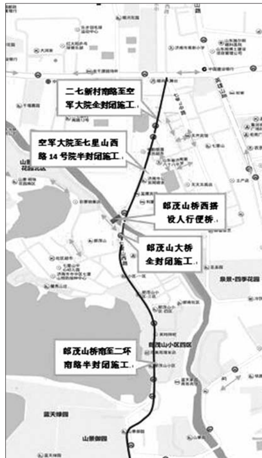
七里山西路南段下周五起施工。

施工期间,过往社会车辆可绕行阳光新路或英雄山路,驻地车辆利用兴澜路及七里山南村道路出行,并按照道路指示标识及施工现场交通疏导人员指挥行驶,注意行驶安全。