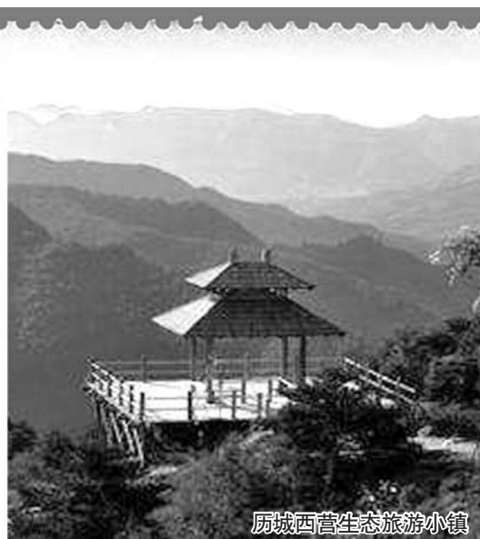
历城西营生态旅游小镇