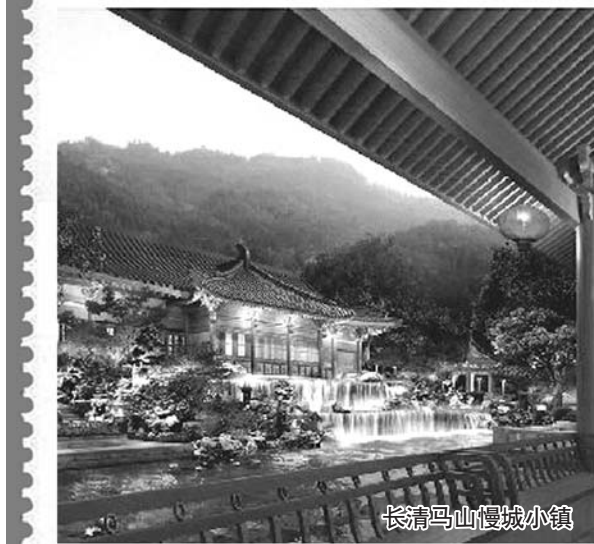
长清马山慢城小镇