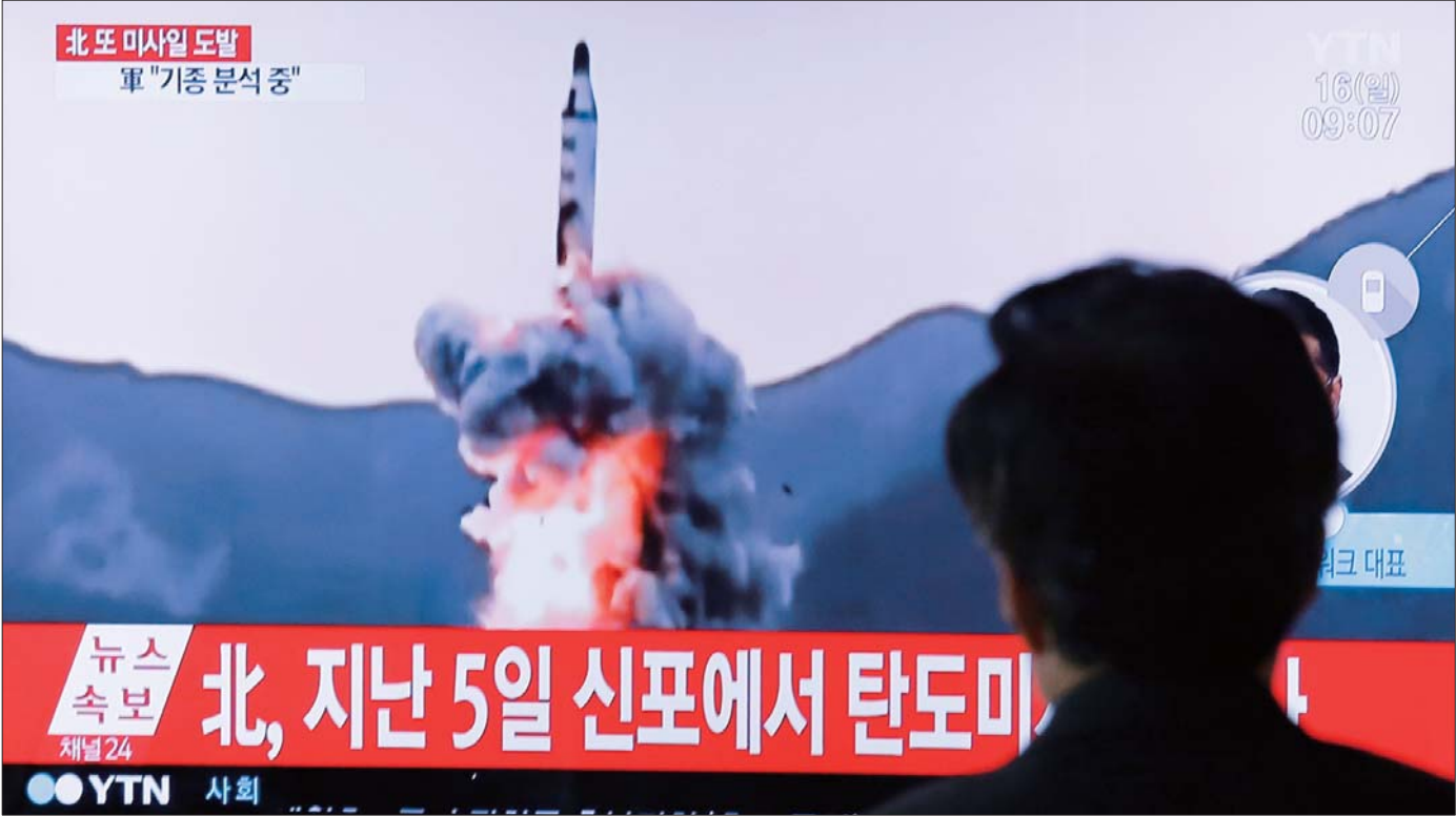
4月16日,在韩国首尔,一名男子在火车站观看朝鲜试射导弹的新闻。

针对朝鲜这次导弹试射,美军太平洋司令部表示,美军将全力与韩国和日本密切合作,维护地区安全。