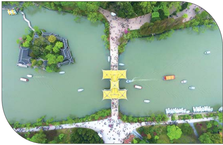
▲瘦西湖标志景观“五亭桥”。 ▼瘦西湖秀美。