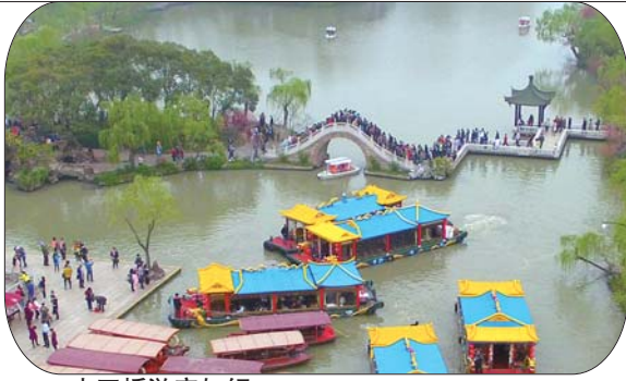
二十四桥游客如织。