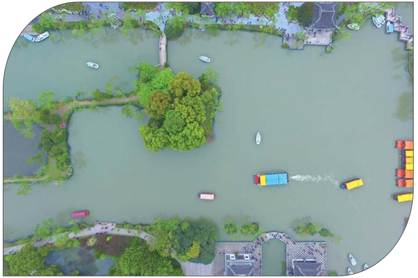
▲瘦西湖的“瘦”字说的是瘦西湖的线条。 ▼五亭桥、白塔都是扬州的地标建筑。