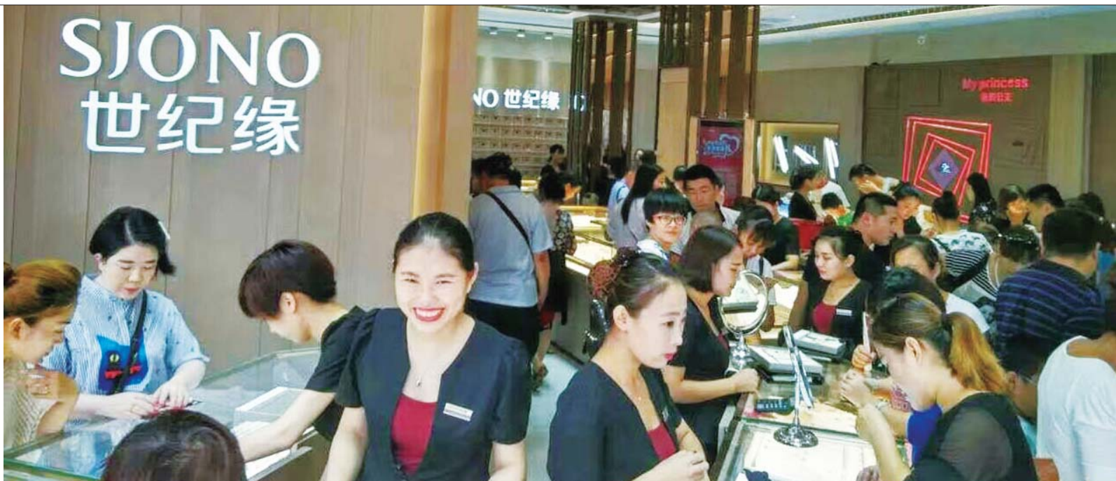
五一来临,本地珠宝领导品牌世纪缘顾客爆棚,这次免费送黄金,再次引爆市场。