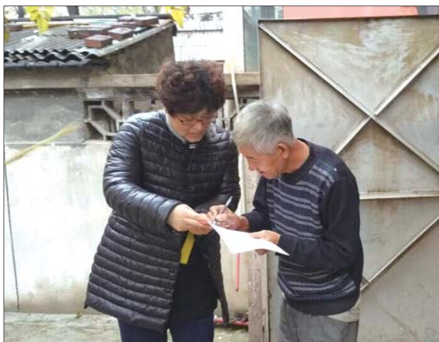
◀社区干部深入到居民家中，提供服务。