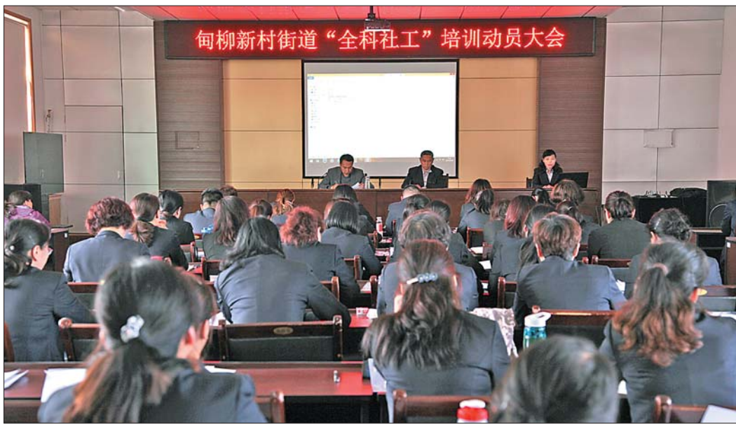
▲旬柳各社区干部参加“全能业务”培训。

街道投入资金为社区工作人员配置了“手持移动服务端”，并将前期街道自主研发的党建、人社、城管、综治等多套服务系统及社区基础信息“大数据”植入服务端，开发建成“网格管理员”系统。下一步，“全科社工”将在社区网格中第一线、第一时间为居民答疑解惑、提供服务，真正实现“琐事不出格，小事不出居”，让居民少跑腿办好