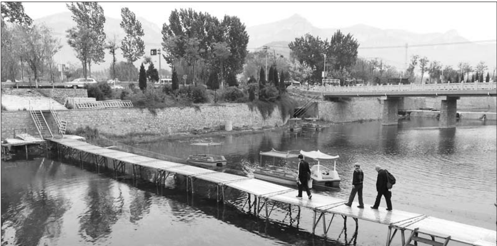
五一前,济南门牙景区不少农家乐还为生意犯愁。

今年五一假期,济南南部山区的锦绣川水库、黄巢水库、大小门牙景区的人流更多了,这与假期气温较高有关,更与南部山区拆违拆临、生态保护和农家乐提升有关系。水源地的违建农家乐被拆除或关停,部分以往与脏乱差脱不开关系的农家乐就餐环境得到了提升。风景美了,有吃得更放心的地方了,美景与农家乐各自归位。济南市旅游行业专家陈国忠认为,南部山区的拆违拆临是南部山区旅游可持续发展的重要一环,而农家乐等形态的开发都要以保护环境为前提。