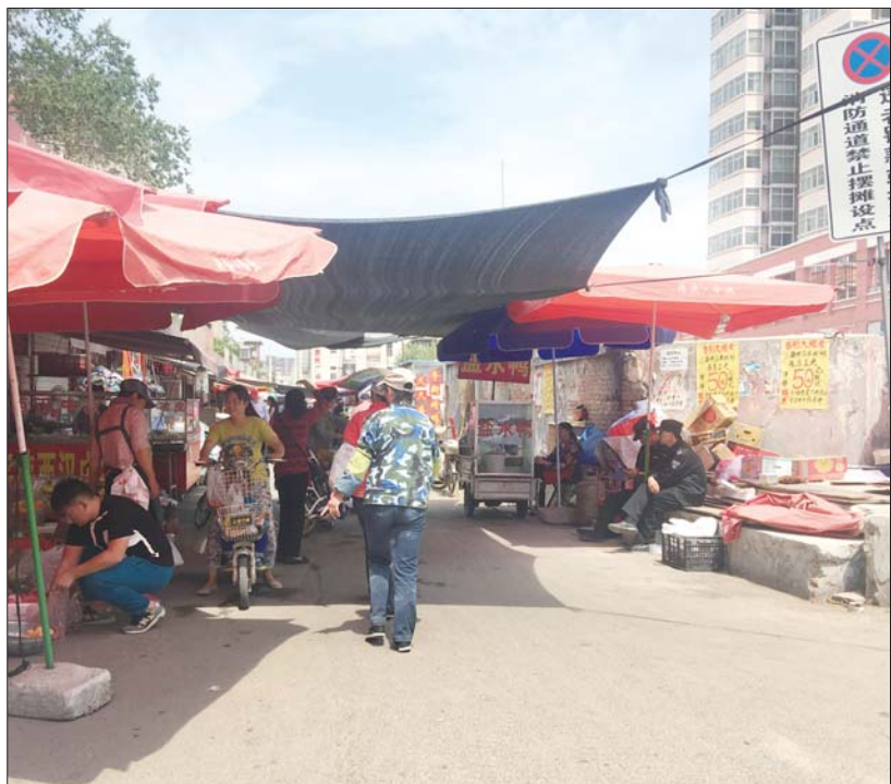
占道遮阳伞伸到了马路中间。本报记者 孙业文 摄

目前该项目正处于环评初期阶段,此次公示是为市民和社会各界,尤其是工程附近居民更好地了解该项目,并欢迎市民向建设单位及环评单位提出意见和建议。