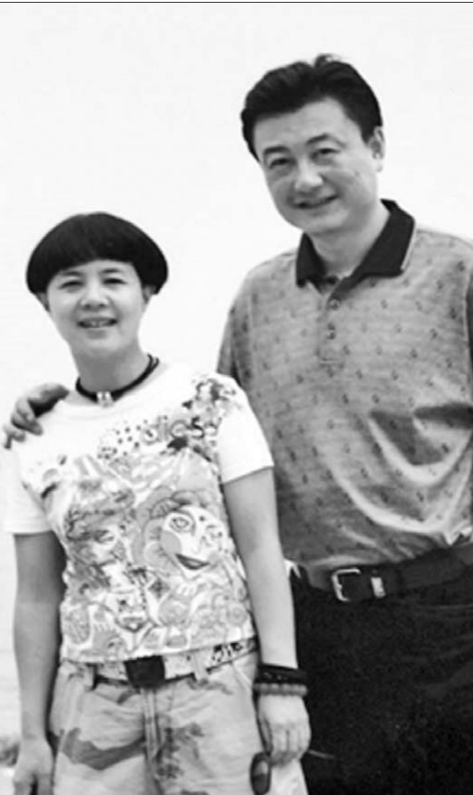
央视《新闻联播》主播王宁今年4月离开主播台,退居幕后变身暖男。

今年4月,52岁的王宁正式离开中央电视台《新闻联播》主播台,成为继李瑞英、张宏民、李修平之后,又一个离开一线的《新闻联播》播音员。至此,他已经在《新闻联播》工作了整整28年,这28年几乎贯穿了王宁的整个职业生涯。退居幕后的王宁将如何规划未来的日子?