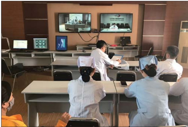
梁山县人民医院医生和省专家会诊患者病情。

便,为使患者得到有效治疗并免去奔波之苦,同时节省就医费用,梁山县人民医院第一时间与山东省立医院联系,决定对该患者实施急远程会诊。通过相关影像资料的传输、实时语音视频系统,双方专家对病例进行深入讨论,并进行病理诊断分析,形成了进一步治疗方案。