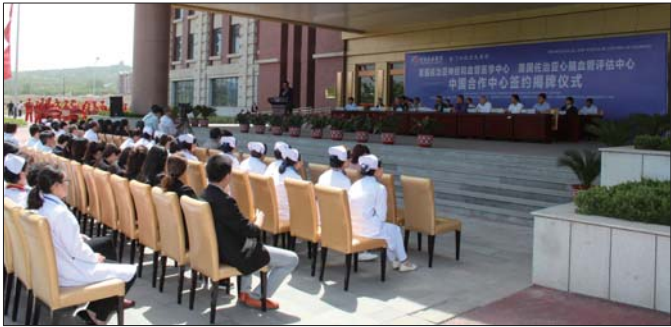
签约揭牌仪式现场。