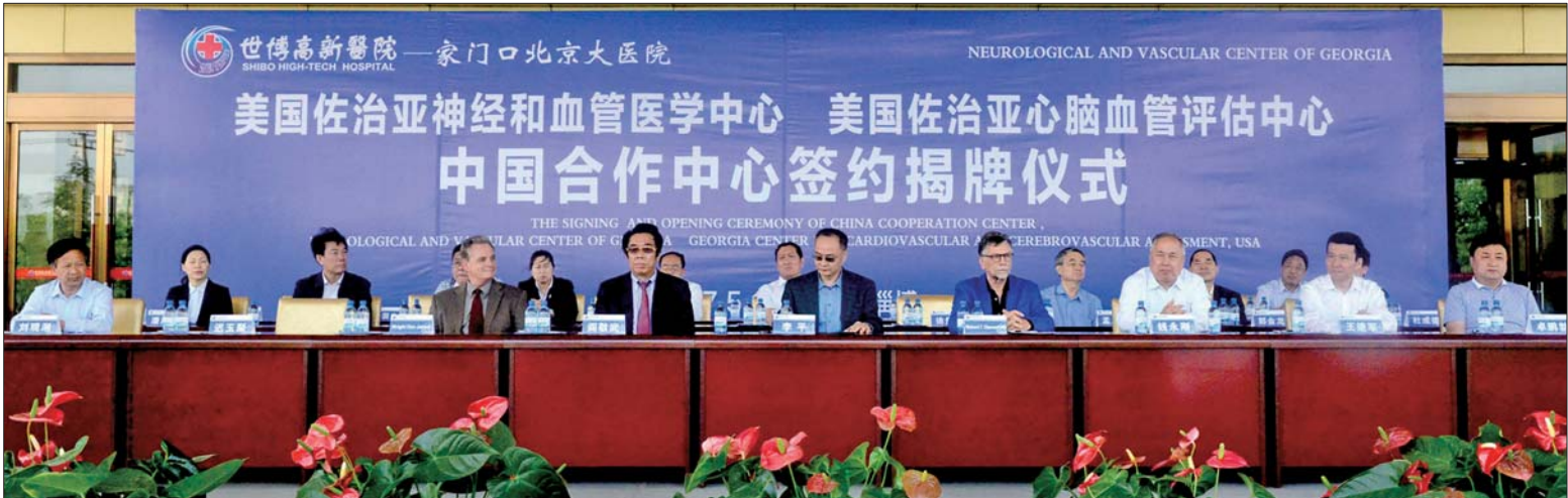
签约揭牌仪式现场。