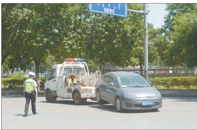
济南高新区开拓路上一辆违停轿车被高新交警拖离。

警力不足的情况下,如何保证禁停的落实?停车位缺口原本巨大,禁停之后市民又该怎么解决停车难?通过禁停真的能缓解拥堵吗?百路禁停后一系列问题都有待解答。