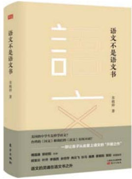
《语文不是语文书》 苏祖祥 著 东方出版社

这也成为他 2014 年“美国语文观察”的开始。当时,正好山西的老牌杂志《名作欣赏》找我约稿,我便把他推荐给了