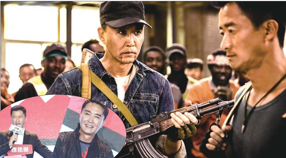
“达康书记”吴刚在《战狼2》中演一位参加过越战的老兵。