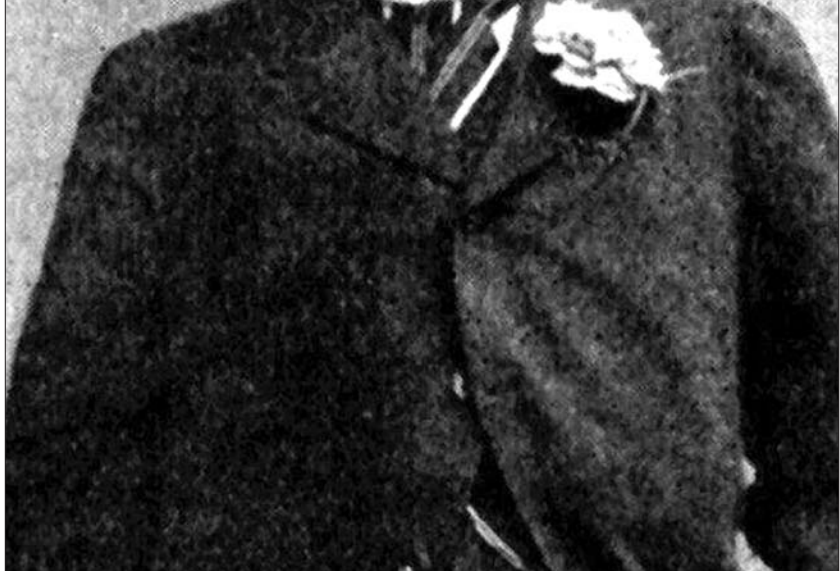
罗斯柴尔德五兄弟

怎么又是罗斯柴尔德家族?如果你喜欢混迹于各大网络论坛国际版,或是对近年来微信上流行的各色阴谋论有所耳闻,一定会发出如此疑问。这些捕风捉影的传闻背后,真相究竟如何?今天我们就来深扒一下这个阴谋论者们很喜欢的家族,以及有关它的种种阴谋论。