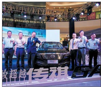
传祺GA8 2017款上市发布会现场

据了解,广汽传祺上市6年来年复合增长率超85%,优质高速增长领跑中国品牌,广汽传祺敢以新荣耀接续旧辉煌,敢将心中向往变为身边所享,面向未来,广汽传祺将持续发力高端市场,引领中国品牌向上。同时