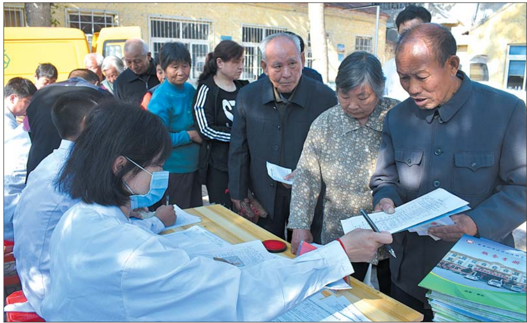
海东村村民现场领取自己的家庭医生签约协议。

另外,针对长期卧床或行动不便的慢性病患者,该院还提供入户就诊或接送到卫生院住院治疗的特殊服务。截至目前,该院已经与辖区内2864人签约,其中老年