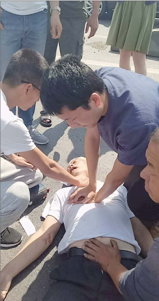
急救现场。(视频截图)

5月28日上午，在滨州市316省道与220国道交界处附近发生一场车祸，一位年近七旬的老大爷躺在地上，口鼻出血，昏迷不醒。正当众人不知所措时，路经此处的滨州医学院附属医院8名医护人员急忙出手施救，心肺复苏、人工呼吸时间长达半小时，一直等到120救护车来到后才离开。