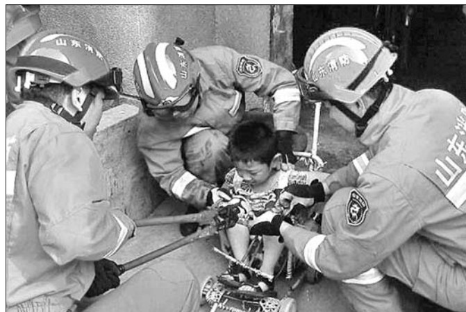
消防官兵利用绝缘钳从童车一端小心翼翼地剪切。(视频截图)

本报潍坊5月29日讯 (记者 尉伟) 29日15时37分,潍坊安丘市消防部门接到一起求助警情,因家长疏忽大意,一名5岁多的儿童将身体卡在童车内,无法出来。接到报警后,消防官兵立即赶赴现场处置,成功解除险情。