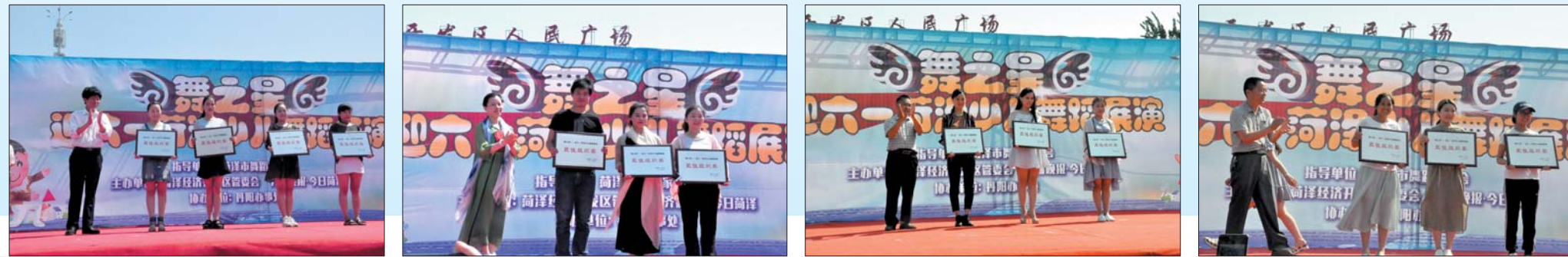
与会领导为演出单位颁奖。